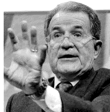
Romano Prodi, 75 anni

«Se si riparte dai summit franco-tedeschi ho l'impressione che non si sia imparato molto. Non è questa l'Europa che sognavo, per la quale abbiamo lottato»