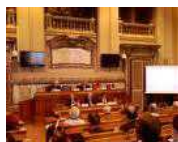
L'interno della sede del Cnel