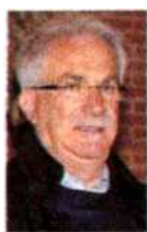
Qui sopra, il segretario generale della Cisl Raffaele Bonanni (1) e quello della Uil Luigi Angeletti (2)