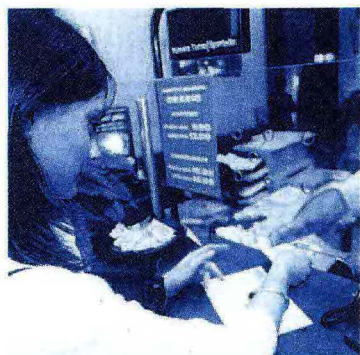
Il bond «sociale» prevede che una quota dell'emissione, normalmente lo 0,5%, vada a iniziative di carattere sociale come finanziamenti a scuole, ospedali, università, fondazioni

I social bond Ubi Comunità sono nati nel 2012 e si tratta di titoli obbligazionari che oltre a garantire un ritorno sugli investimenti effettuati offrono ai sottoscrittori la possibilità di sostenere iniziative caratterizzate da un alto valore sociale. Il primo tipo di social bond prevede la devoluzione ad associazioni, fondazioni, scuole, università e ospedali di una parte dell'importo collocato, normalmente lo 0,5%. I soggetti beneficiari devono essere realtà conosciute e radicate nei territori oltre a possedere la stabilità di cash flow e un adeguato merito creditizio. Il secondo modello dei social bond promossi da Ubi Banca prevede che tutto l'importo raccolto — prestito obbligazionario — e non solo una — sia usato per finanziare iniziative di impatto sociale, preferibilmente collegate a realtà operanti in specifiche aree o settori. Grazie ai social bond è possibile costituire piattaforme all'erogazione di finanziamenti a medio-lungo termine in condizioni competitive per consorzi, imprese cooperative sociali. Fino all'agosto 2013 Ubi ha emesso bond per un valore totale di 317 milioni di euro, di cui è permesso la devoluzione di contributi per un valore di 17,5 milioni destinati a finanziare attività e progetti delle cooperative sociali. Gino Mattarelli. Diversi altri soggetti, ad esempio Prossima, hanno lanciato iniziative analoghe.