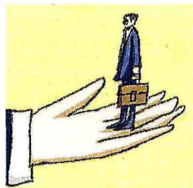
ILLUSTRAZIONE DI FABIO SIRONI

L'80 per cento delle aziende italiane con più di 500 addetti ha avviato esperimenti di welfare aziendale e ogni 150 euro investiti hanno portato un guadagno stimato in 300 euro tra risparmi effettivi e aumenti di produttività.