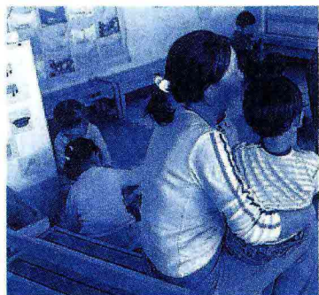
Dallo scorso ottobre il Colorificio San Marco offre un sistema di servizi accessibili online su istruzione, cultura e ricreazione, servizi sociali, salute e previdenza