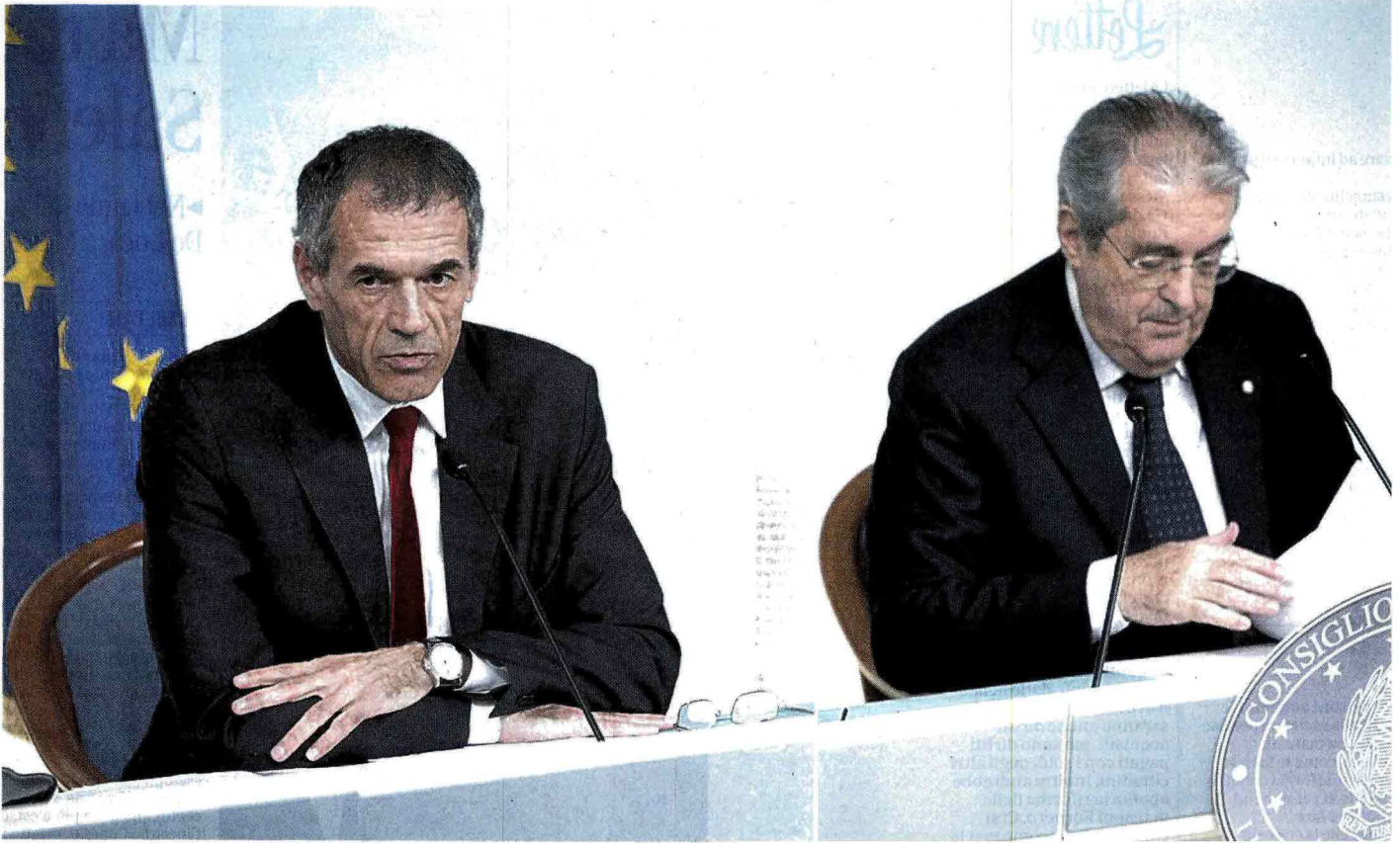
Carlo Cottarelli e Fabrizio Saccomanni durante la conferenza stampa a Palazzo Chigi