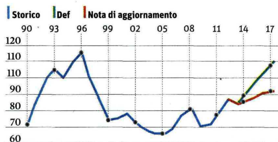
Fonte: Istat, Def 2013, Nota di aggiornamento 2013